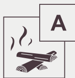
A. Feste Stoffe