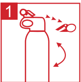
Retirer la sécurité

Testé et recommandé par les experts de la lutte anti-incendie et des assurances immobilières.