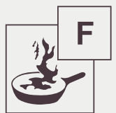
F. Huiles graisses alimentaires